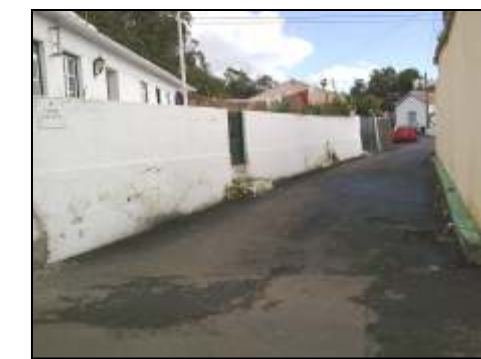
Canada Entre Picos