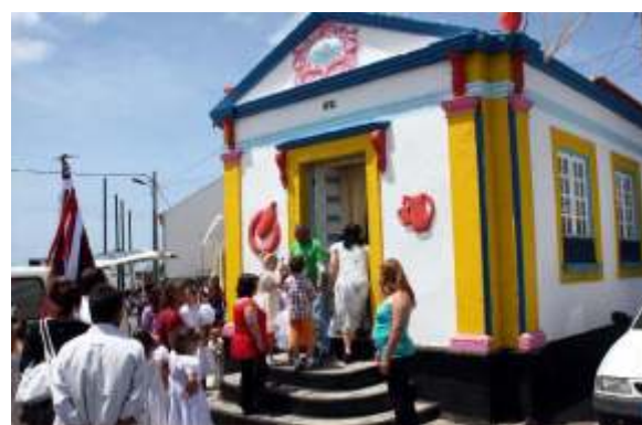
Coroação das Festas do Terreiro – Bodo do Mar