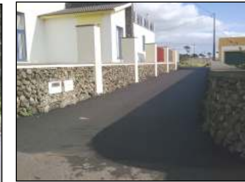
Canada do Lagarto