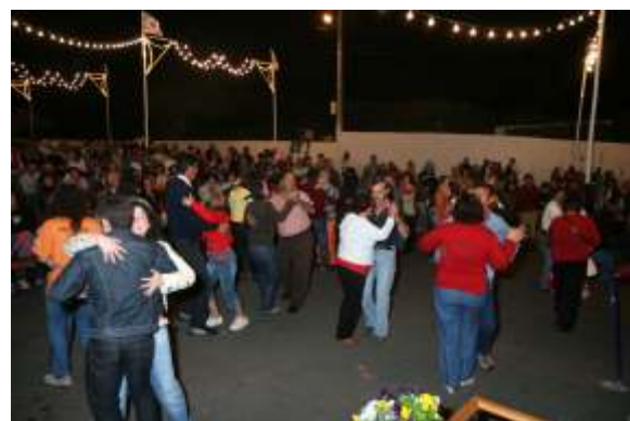
A Animação nocturna chamou dezenas de pessoas