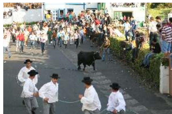
Tourada à corda no Cantinho

Uma vez mais o esforço das comissões foi compensado com a grande afluência aos diferentes eventos. Pontos altos foram as touradas à corda no Terreiro e no Cantinho e os Bodos da Terra e do mar, mostrando que as tradições permanecem ainda bem vivas.