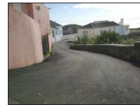
Beco da Terra alta