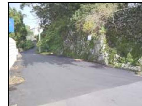
Canada do Martelo

Procedeu-se ao asfaltamento de algumas ruas secundárias da freguesia para facilitar a circulação a a veículos e peões.